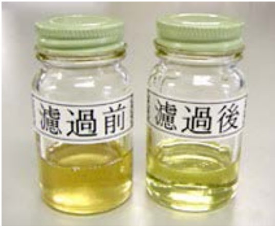
油のろ過前と後の色比較